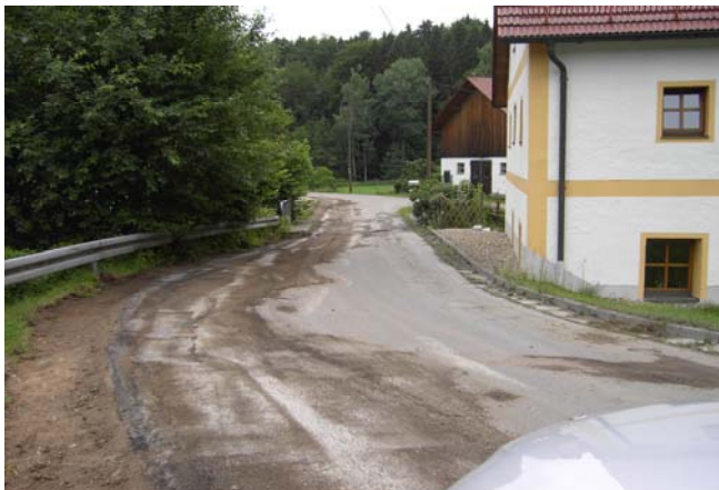
GVS Göppenbach - Hornismühle

Weitere Straßenbaumaßnahmen werden derzeit an der Süßenbacher Straße zwischen Pfaffenfanger Kreuz Richtung Willmannsberg bis zur Landkreisgrenze sowie an der Gemeindeverbindungsstraße Göppenbach in Richtung Hornismühle durchgeführt. Diese Maßnahmen waren ebenfalls durch starke Schäden dringend notwendig geworden. Die Komplettsanierungen belaufen sich auf insgesamt ca. 400.000 € Auch hier flossen Fördermittel des Freistaates Bayern nach Art. 13c FAG bzw. BayGVFG. Die Fertigstellung der beiden Straßen ist für Mitte August geplant. An dieser Stelle möchten wir uns für die Unterstützung bei unserer Landtagsabgeordneten Sylvia Stierstorfer bedanken.